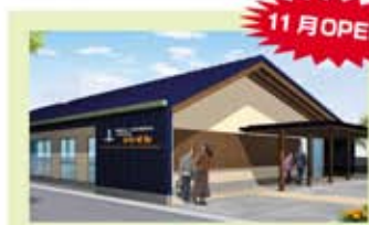
〒422-8027 静岡県静岡市駿河区豊田1丁目4-44

年始号で紹介しました、小規模多機能型居宅介護施設の名前が決まりました。皆様に親しみを持っていただけるよう、静岡市の鳥である「かわせみ」を施設の名称とさせて頂きました。「かわせみ」は、透析を受けられている方にもご利用頂け、デイサービス、炭酸泉を利用した足浴、専門スタッフと連携して行うリハビリなどを予定し、皆様の健やかな生活が維持出来るように、職員一同全力でサポートしてまいります。どうぞよろしくお願致します。