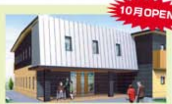
〒453-0815 愛知県名古屋市中村区北畑町4丁目1

この施設は、 認知症の方が共同生活を送る「グループホーム」とご利用者のニーズに合わせた利用が可能な「小規模多機能型居宅介護」 の2つが併設してできて