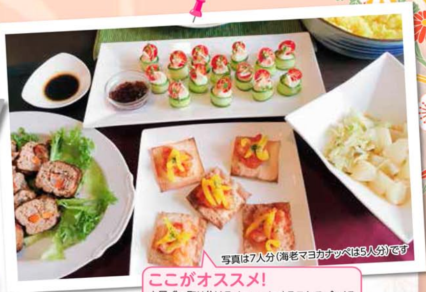
写真は7人分(海老マヨカナッペは5人分)です