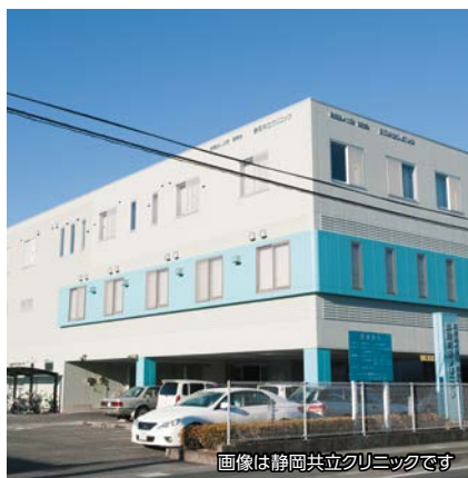
画像は静岡共立クリニックです

静岡共立クリニックから南へ1km程離れた場所に、デイサービス・訪問介護・宿泊の3つの機能を持ち ご自宅を中心に利用出来る小規模多機能型居宅介護施設を開設 することになりました。この施設は介護保険制度により運営され、月額費用が定額(一部費用負担有)となり 通院に不安がある方も安心してご利用 頂けます。透析患者様に特化した小規模多機能型居宅介護施設は静岡県中部そして 偕行会グループとしても初の試み となります。透析医療と介護の連携を高め患者様とご家族に、長く元気に笑顔でお過ごし頂けるよう職員一同全力で取り組んでまいります！