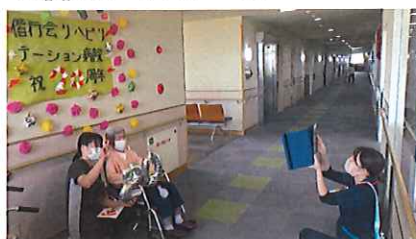
写真ブースの前でパシャリ📷