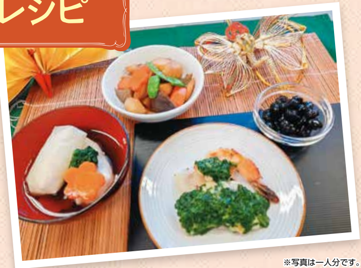
※写真は一人分です。

エネルギー …………… 552kcal たんぱく質 …………… 25.3g 食塩相当量 …………… 2.1g