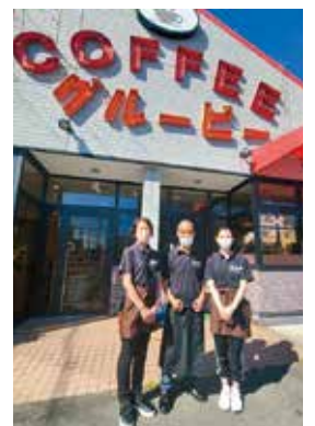
●スタッフの皆さん

今後、独居の方を集めて食事会をしたいと考えてます。独居の方はお話し好きな方も多く、グルービーが憩いの場になれば良いなと思っています。