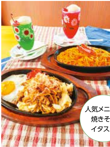
人気メニュー 焼きそば・ イタспа

「昔ながらの喫茶店」です。人気メニューは焼きそばで、その他にもイタспаやあんかけспаといった名古屋ならではのメニューもあります。最近ではみそ／ソースカツ丼もはじめました。