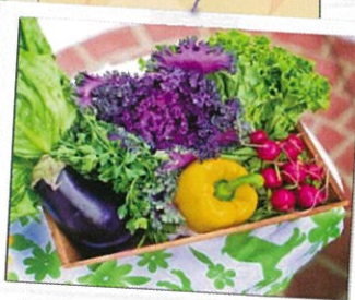
朝穫れ野菜マルシェ♪