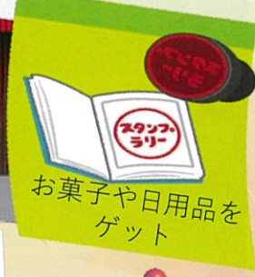
お菓子や日用品をゲット