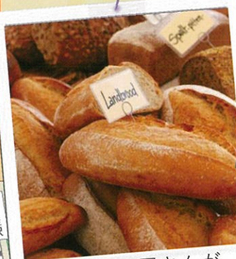
人気パン屋さんが出張販売！

※当日は会場周辺では混雑が予想されます。お越しになる際は公共交通機関をご利用下さい。