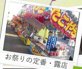
お祭りの定番・露店